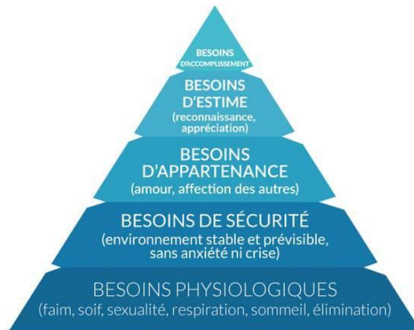
Pyramide de Maslow